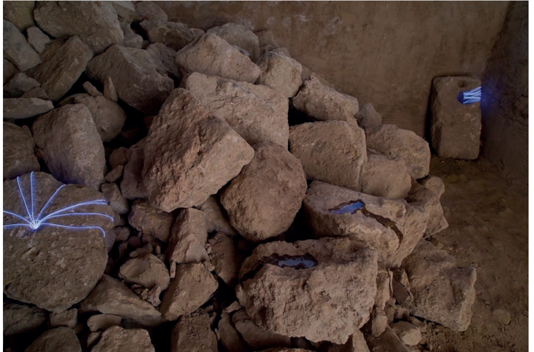
C'est pour cela qu'on aime les libellules, Pierres, neonflex et résine epoxy, 2019