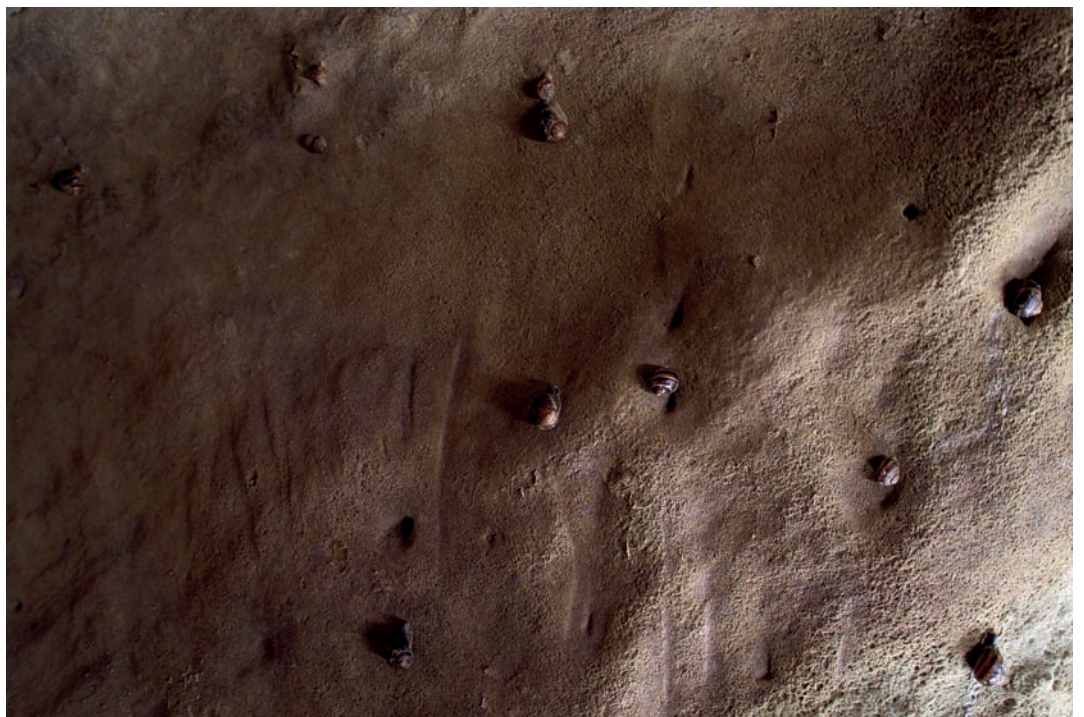
Lubricated walls (detail), Installation in situ pour escargots et salades Dimensions non déterminées, 2019