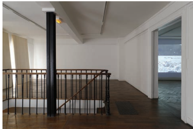
Vues des espaces d'exposition de la Galerie du Crous de Paris, 11 rue des Beaux-Arts, Paris, 6ème.